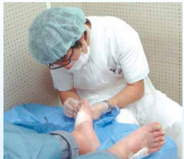
たこ・うおの目処置