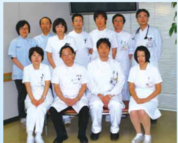
フットケアチームメンバー